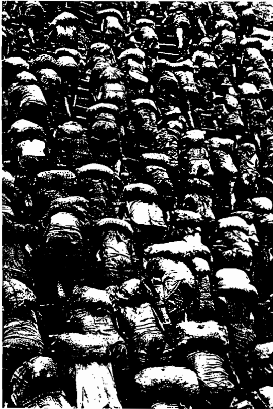
Sebastião Salgado. Atines d'or de la Serra Pelada, Brésil, 1986 Paris, agence Magnum